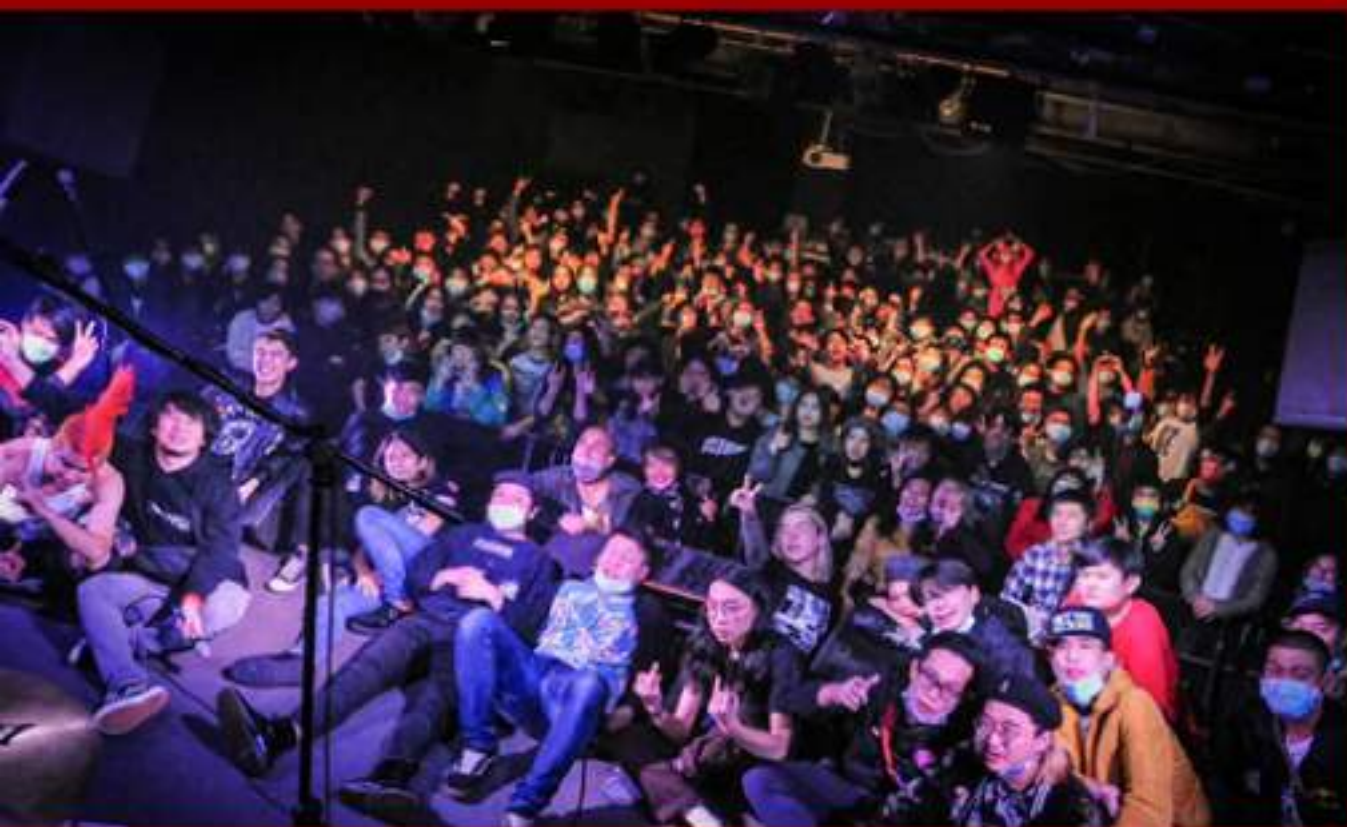
第六屆Anarchy in Taiwan活動合照

樂團內的角色早期是以阿嵐及式垣的創作為主，第二張EP《銜尾 Dawn State》則是由橋男及阿嵐共同創作。分工上，主要是由阿嵐或橋男獨立創作整首歌，再到練團室與團員進行管樂或是細部編曲。整體創作發想主要是以橋男及阿嵐為出發點。有時橋男會創作完整首歌的歌詞，再交由阿嵐演唱，而阿嵐也會依據自身唱法或是習慣，稍加修飾詞彙使整首歌曲唱起來更舒適。