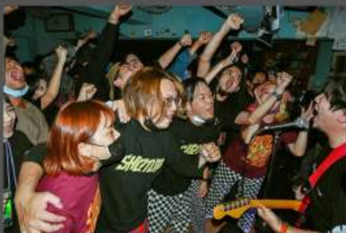
「TIME TO GO!」專輯巡迴台南最終場