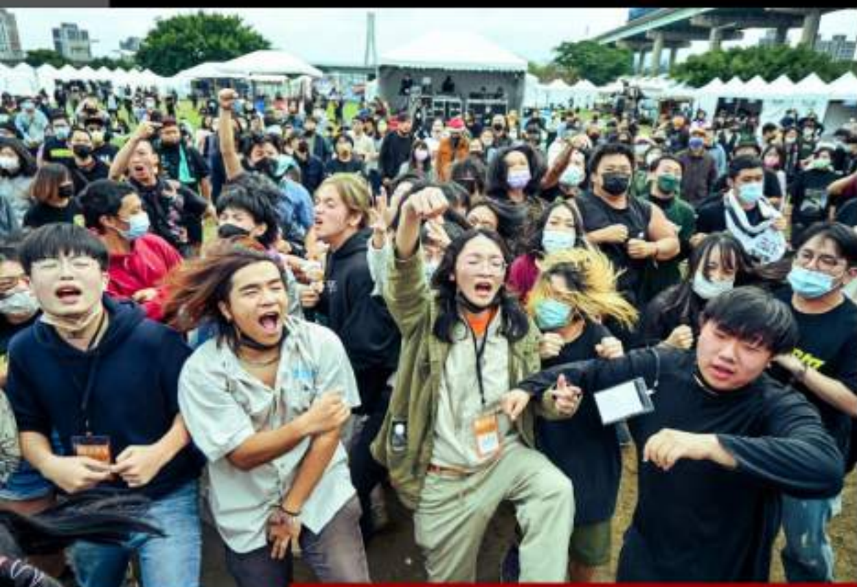
2022年爛泥發芽音樂節

但是阿嵐在訪談中透漏未來並不會每年舉辦Anarchy in Taiwan，除了負擔太過巨大外，他也希望能夠在舉辦前先做好充分準備，舉辦音樂季才有推廣龐克搖滾的作用。從這些細節可以發現阿嵐的心中其實是有計畫，且不斷致力於推廣台灣龐克搖滾，希望讓更多人看見台灣龐克的美好。