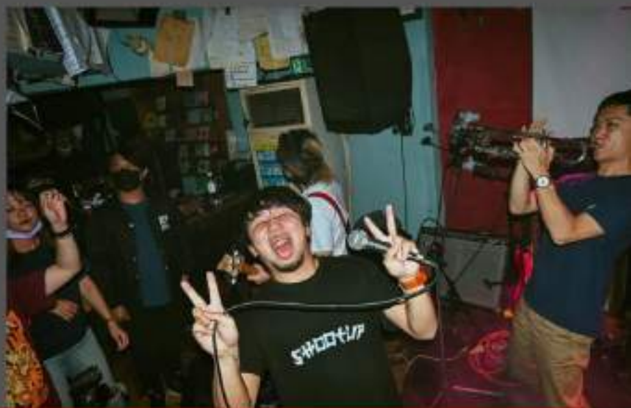
「TIME TO GO!」專輯巡迴台南最終場