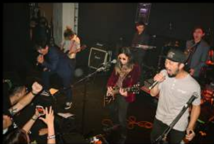
「TIME TO GO!」專輯巡迴台北求婚場 (真), photo by Leon's Photography × 周惠民

阿嵐也覺得這樣的經驗可以套用在音樂上。一開始他的吼腔沒辦法像知名樂團主唱一樣沙啞，但是他仍努力學習，直到領悟出其中的道理。所以在玩樂團的路上，阿嵐不斷強調要一直努力。無論結果如何，只要你問心無愧，之後的結果也會逐漸變成你想要的樣子。