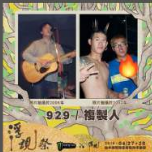
台中廢人幫「複製人樂團」