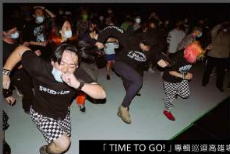
「TIME TO GO!」專輯巡迴高雄場， photo by Leon's Photography 同愚民

雖然「SHOOT UP」歌詞裡充斥仇富或是諷刺的言論，但他們描述自己並不是批判性很重的樂團，反而是以譏諷的態度看這個世界，因為大家都知道什麼是現實，所以他們不會以安慰或是憤世嫉俗的角度創作詞曲，而是以看似激進卻又客觀的態度來讓社會大眾看清社會的現實面，試著在這世界苦中作樂。