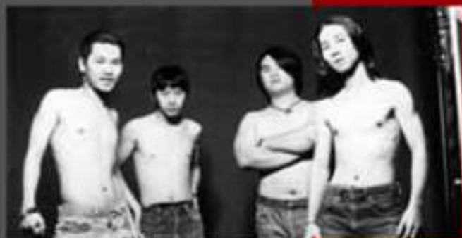
台中廢人幫「無政府樂團」

這股能量也在2015年孕育出「愁城」，以馬克思讀書會、音樂活動，繼續推廣龐克反抗意志。而「愁城」內的成員與「無妄合作社」（前身罷黜者）、「共犯結構」、「餵飽豬」、「河童鄉」等龐克樂團有關。所以「SHOOT UP」在台灣龐克的歷史脈絡上可說是承先啓後，為龐克搖滾持續奮鬥的勇者。