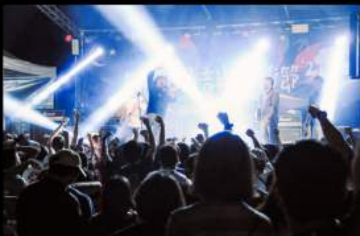
2021無限自由

但是在樂團成長中，每位團員都會經歷不同的人生旅程與規劃，造成樂團成員輪流替換，但是橋男和阿嵐兩人也在這個過程中一直成長。早期他們會覺得團員的離開是天崩地裂的壞消息，但是現在他們也體會到現實的無常，對一切看得更開，這樣的變化也能從許多歌詞中體會到他們豁達的人生態度。或許許多年輕人覺得玩樂團很熱血、很浪漫，長大後虛幻的美夢也必須經過現實的考驗。雖然樂團的未來無從預測，但是年少輕狂的回憶將刻骨銘心。