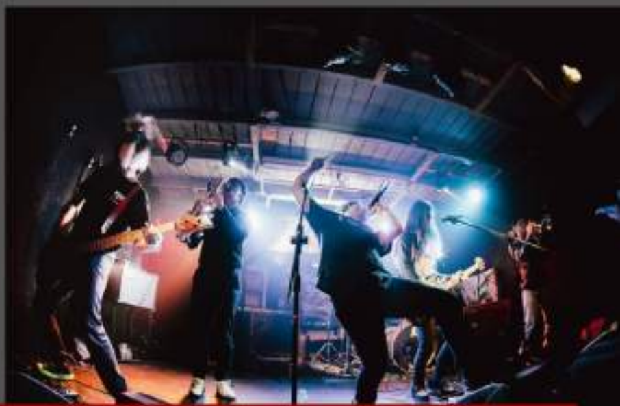
POKE POKE ROCK 彰化場, photo by 陳佑筑

回顧「SHOOT UP」的每場表演，聽眾以外人居多，不免讓人好奇發生這種現象的原因為何。橘男認為這和從小聽音樂養成的文化有關。無論歐美或是日本，人們從小就習慣聽一些經典搖滾或是龐克搖滾等音樂，所以這些音樂對於外國人來說習以為常。但在台灣，大部分的聽眾都是聽華語流行音樂成長，所以也較難接納其他類型的音樂。然而橘男覺得觀眾比例的問題只是文化上的差異，並不構成太大的問題。