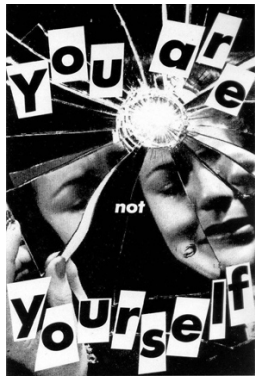
(Barbara Kruger, 『You are not yourself』, 1981)

在我高中時期，每每走經捷運台大醫院站附近的書店雜誌上，看到了下圖這樣的一個作品『You are not yourself』，有一組將用銳利邊角切割的女人畫像總是吸引著我，如避雷針被閃電擊中的感覺，作品中則堆疊的是醞釀中的悲情，整個圖片的最中間則是如同被玻璃打破的窟窿，旁邊則環繞著一環如同鏡面碎裂的裂痕，最上方明擺著明顯的白字版有著清晰的大字，注意力被這幅作品拉走的我，因為知道作者所想傳遞的寓意及社會價值，所以以前就隱約察覺到這塊造型奇特的藝術雜誌上看似風格簡單的作品，是會讓人懷著悲傷的感覺。這句話的出現是在描繪媒體對女性個人認同的影響，被塑造成符合特定標準的形象，它可能意味著女人在被塑造成特定的形象的過程中，早已如同靈魂被分割般，失去了真實的自我。