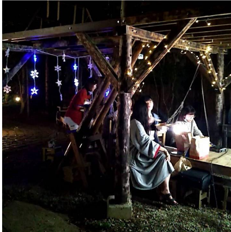
在樹屋舉辦的露天電影院