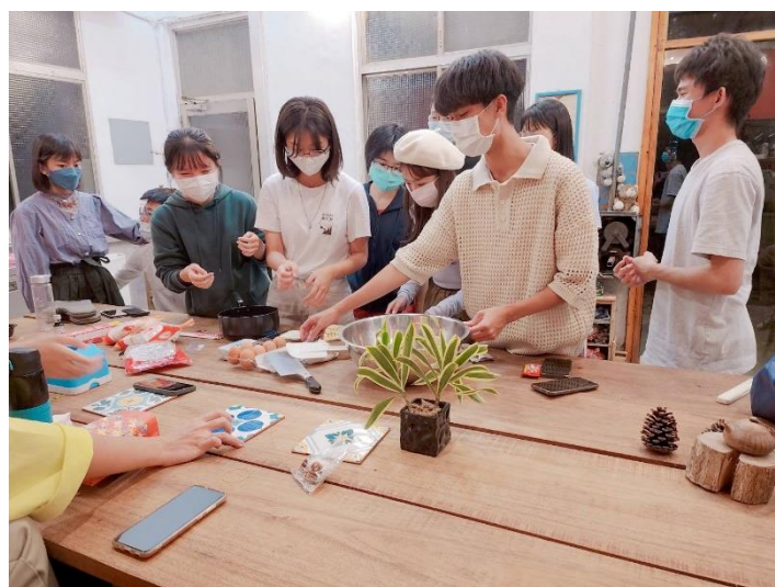
T-House 改建後，作為書院家聚的地點使用情況