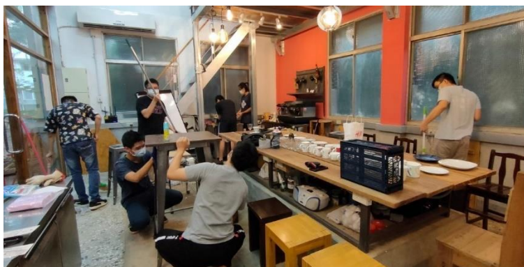
T-House 內部重建情況 (源自：JHill 清華大學齋丘 FB 照片)