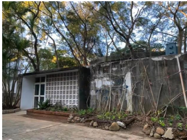
改造後的 BTB+