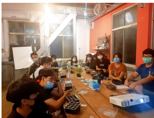
T-House 改建後，作為書院服學的上課地點使用情況