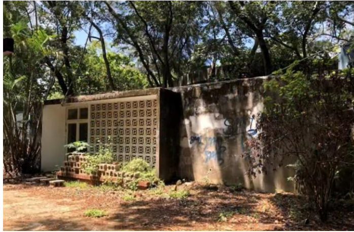
改造前的 BTB+