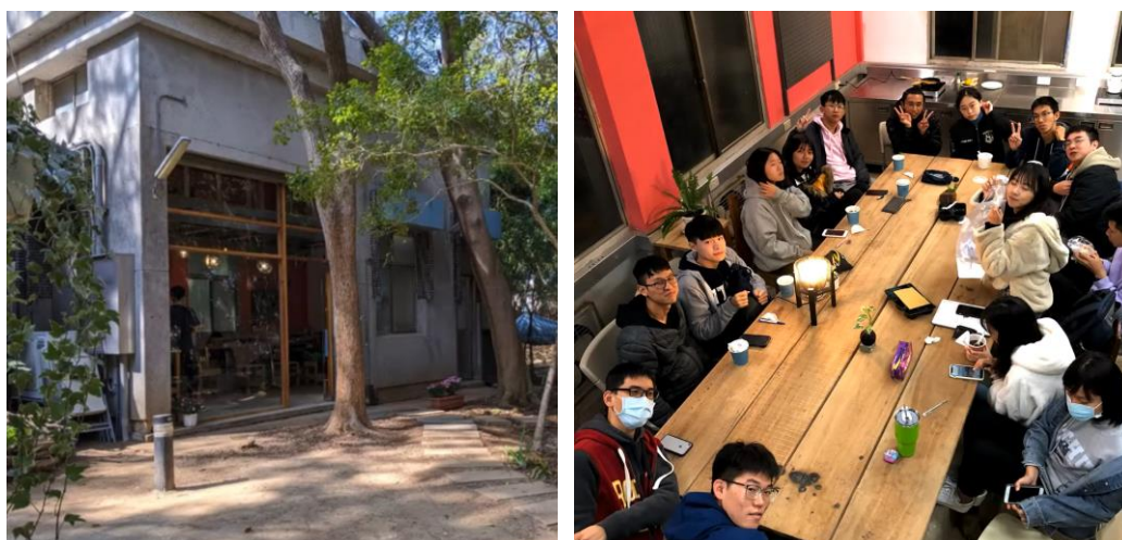
改造後的 T-House；右：外部，左：內部