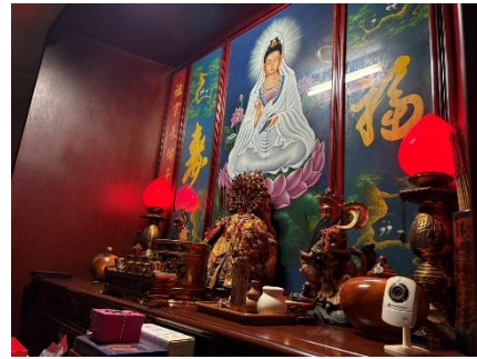
圖 2、圖 3：家中神桌頂桌。（筆者攝，2025.12.20）

頂桌（神聖界）是神明與祖先的居所。背景是一幅玻璃框保護的觀音彩，畫中觀音大士端坐蓮花，法相莊嚴。但這次特別注意到兩側的金色對聯，右聯寫著「佛力永扶家安宅吉」，左聯寫著「祖宗長佑子秀孫賢」。