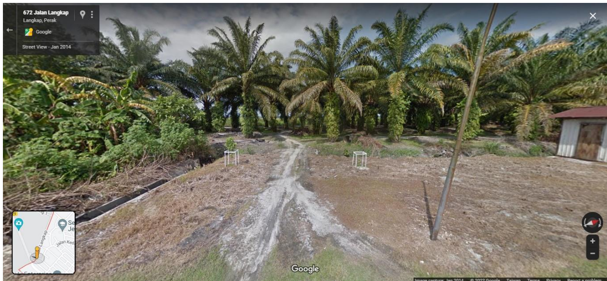
圖四：外公的油棕園，此圖為 2014 年拍攝，2020 年時，政府有在油棕園的入口設立牌子表示著該地的主人及土地面積 7

信在不久的將來水閘新村有望成為出產最多棕油的新村。除了油棕園外，外公外婆也喜歡在房子周圍的空地種植各種蔬菜水果，這一現象也可以在村內其他人的家中觀察得到。我認為出生在戰亂年代的人都習慣依靠自給自足，因此會有耕種的習慣，這樣才能在刻苦的環境中生存下來。而當環境改善後，這種習慣卻停不下來。目前為止，我們家後院種了百香果、紅毛丹、香蕉、釋迦、地瓜葉、蔥、九層塔、韭菜等大約十幾種的農作物。外公說，這是一種珍惜土地的表現，除了可以種給自己吃外，也能和街坊鄰居互相交換彼此的農作物，這樣就可以吃到最新鮮的蔬菜水果。我在家鄉時都會看到每次下廚前，外婆都會到屋外走一圈，之後就拿著一籃蔬菜回來，由於這些蔬菜都是現採現煮，因此口感特別好，而這個口味在我出國後更是懷念。我認為新村的華人因為親身經歷過那種歷史，形成了靠山吃山，靠海吃海的特性，非常善於利用有限的優勢創造生存的條件。