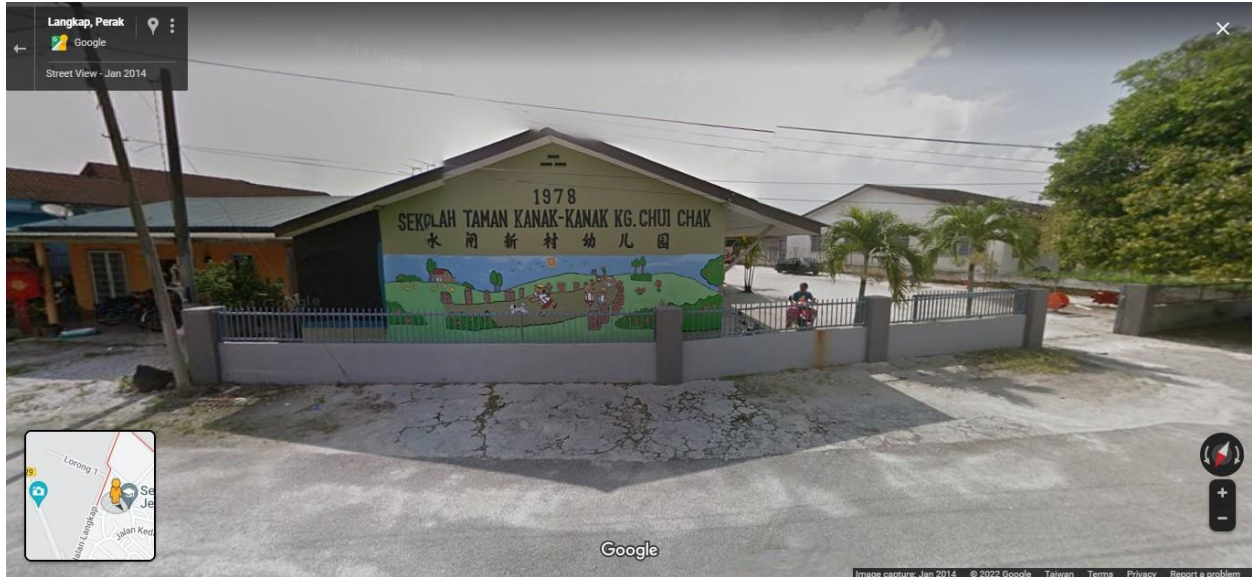
圖十：水閣新村幼兒園 10