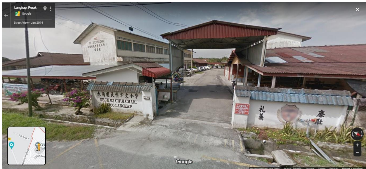
圖九：水閘國民型華文小學 9

家的小孩並收取費用，而這也讓載送學生的行業在我的家鄉中發展起來。據我所知，本校也有許多來自馬來西亞的學生是從安順三民獨中畢業的。由於我從小在家鄉長大，因此我也認為我的求學路徑也會與我的家人一致，從水閘華小畢業後再到安順三民獨中就學。直到我5歲那一年，因為父親換了一份工作，需要舉家搬遷到外縣市，我也必須到另一個地方求學了。這個消息對當時的我來說有如晴天霹靂，因為我在新村內已經結交了許多好友，甚至與老師的關係也非常好，換了一個新的環境就必須重新熟悉。我還記得那時每天去上課我都會趁午休時間躲到廁所內偷偷哭泣，有時哭得太久甚至錯過了午餐時間。近期，水閘新村也面臨了人口減少的問題，大部分的新生代都選擇到外縣市發展，新村則成了老人們的聚集地，因此，水閘新村的人口近幾年都呈現負成長的現象。據外公所說，水閘華小的班級也大幅縮減。從前，每個年級都會有四班到六班，而今時最多的只有兩班，一些班級也只有寥寥數人，去年畢業的小六生甚至只有三十餘位。