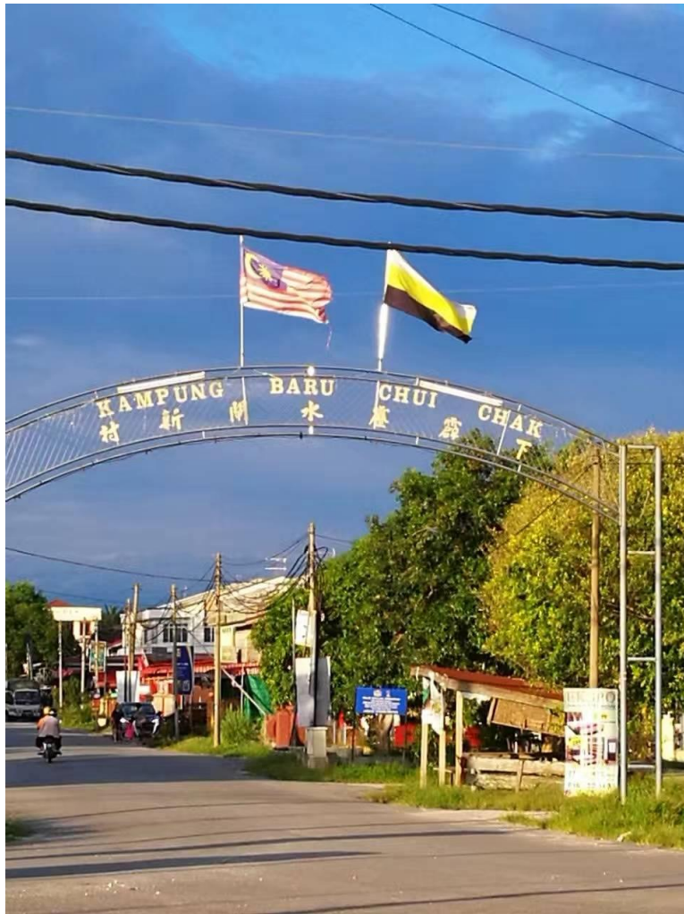
圖七：親自拍攝之水閘新村入口

而由於大部分的食物都是煎炸類的，吃得太開心忘了克制就會導致第二天喉嚨不太舒服。此外，觀音廟的對面有一個禮堂，除了是表演的場地外，這裡也是村內舉辦婚禮時宴客的場地。在我的記憶中，觀音廟與食物的關係可說是密不可分，因為大部分的時間我都是在外面的市集覓食或參與婚宴，甚少進入廟中參拜，感覺對於觀音菩薩有些許不敬。