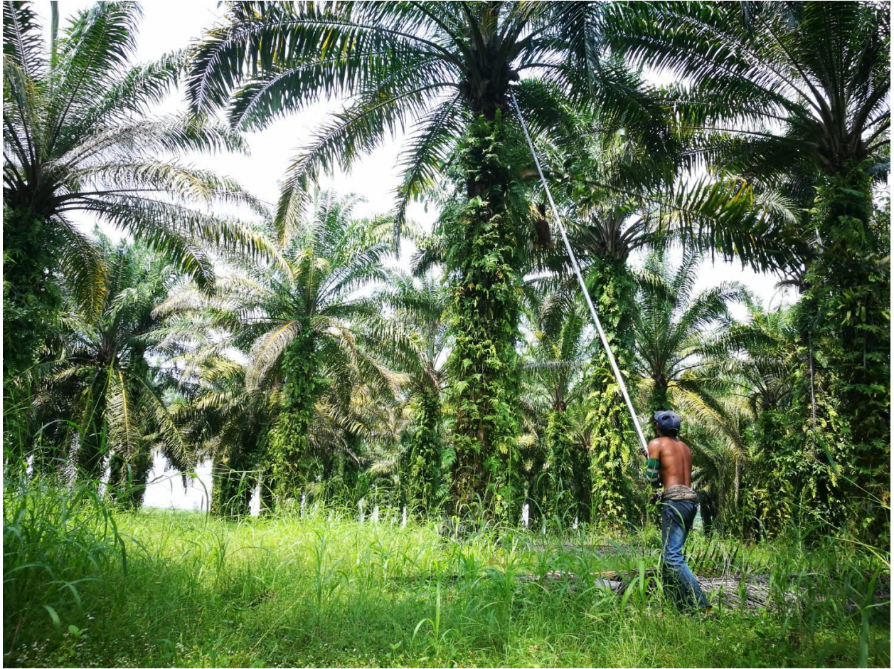
圖五：親自拍攝之收割油棕果實的工人，拍攝地點：外公的油棕園，拍攝日期：2020年2月5日