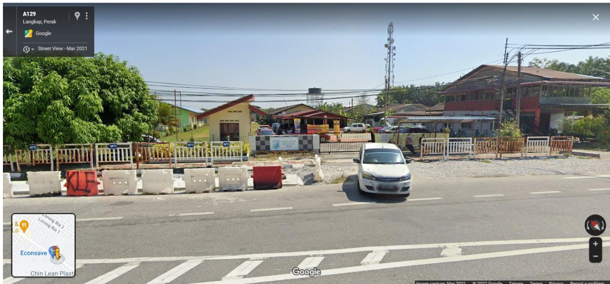
圖十一：冷甲國民型中學 11