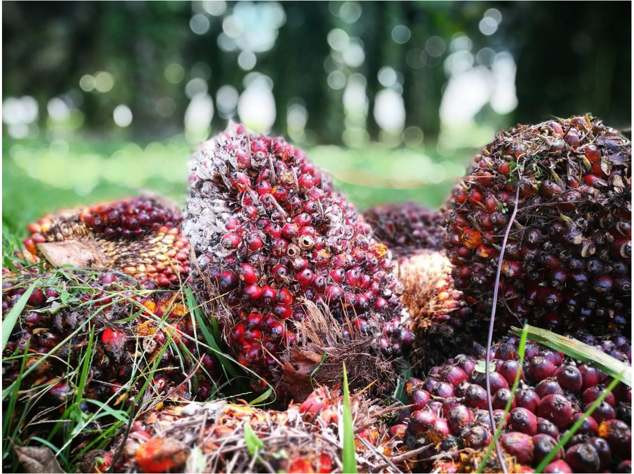
圖六：親自拍攝之油棕果實，拍攝地點：外公的油棕園，拍攝日期：2020年2月5日

駛入新村入口，首先映入眼簾的是觀音廟。據說在新村剛建村時，打雷擊斃村民或村民溺死的悲劇接連不斷的發生。為此，村民們經過討論後，決定在村內設立觀音廟，以讓村民有個心靈寄託並能起到安撫的作用。觀音廟成立後，相對的悲劇並沒有再發生，村內也變得平安無事。在那之前，村民並無特定的宗教信仰，在親身經歷那段歷史後，除了村內的觀音廟外，幾乎每個村民家中也會供奉觀音菩薩。每年的觀音誕，觀音廟都會變得十分熱鬧，除了會有各種表演外，戶外也會有擺攤賣各種小吃。每當我返鄉恰逢觀音誕時，我都陪外婆到觀音廟逛逛，外婆對於以方言為主的京劇表演非常熱愛，就算觀眾席的椅子非常簡陋，外婆依然能一坐就坐上好幾個小時。相較於京劇表演，我更嚮往市集的美食，