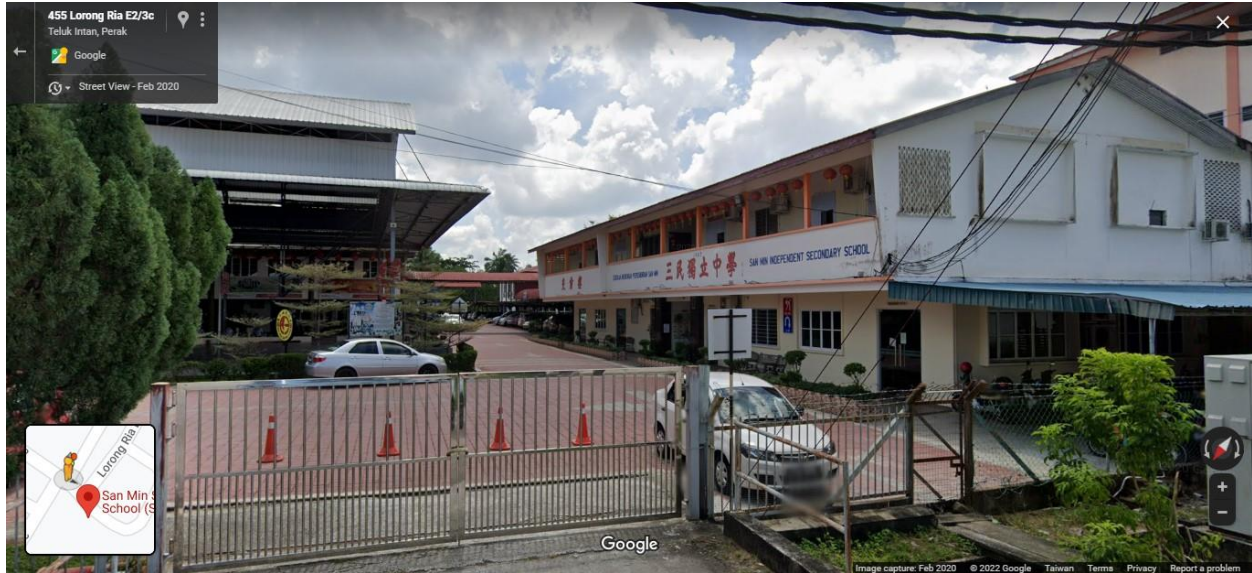
圖十二：安順三民獨立中學 12