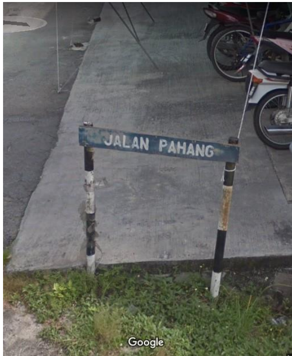
圖三：以州屬命名的街道，圖中的 Jalan Pahang 意指彭亨街，彭亨為馬來西亞的一個州屬 6

十多年前，外公和外婆把 12 英畝的稻田租出去，自己留著 4 英畝的土地種植油棕。據我外公所述，稻農一年只有一次的收成，收入不是那麼可觀，加上大部分的舅舅阿姨們都到外地上班，這一大片的稻田對於他們來說有點吃不消。外公也說道，在他們那個年代，所有的農業種植都必須親歷親為，每逢播種的季節，他們都必須親自插秧及鋤地，一整天工作下來，腰都快沒感覺了，常常回到家後就算很累，但是因為腰部的痛楚而遲遲無法入睡。與稻田相比，油棕一年有三到四次的收成，除了施肥及除草，其他事情如收割及稱重販賣等村內都有專門負責的人，不僅收入增加了，也不會像從前種稻般那麼累。在出國前，我們都會特別選擇油棕施肥的這段時間返鄉，這樣就可以幫助外公減輕負擔。而每次施肥的過程中，最讓我驚訝的時雖然外公已到耄耋之年了，但是在施肥時在他身上卻看不到歲月留下的痕跡，除了腳步勤快外，施肥的手勢也非常的順手，讓我們這些年輕人目瞪口呆，望塵莫及。據外公所說，自從 2000 年後，水閘新村種植油棕的人有逐漸成長的趨勢，相