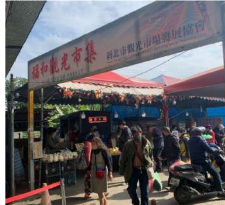
圖一：福和市場門口

都市高速發展，為了配合都市發展，台灣各地一座座的陸橋被興起，對於台灣這地狹人稠的國家，土地必然是非常有限的資源，路橋的興建對於交通有它建造的必要性，這樣不僅可以增加通車路段，橋下還能有空間作使用。不過，陸橋一程不變的型態，它灰濛濛的顏色和它不美觀的外型，橫橫的一大條陸橋彷彿截斷了該地區明亮的景觀，而且若是住宅區周遭，陸橋上呼嘯而過的一台台車子也會為周遭地區帶來噪音影響，我認為，如此種種負面效益使得陸橋成為一種鄰避設施，而如何減少陸橋對周遭地區的負面影響，我想妥善規劃運用橋下空間就是一個很好的解決辦法。