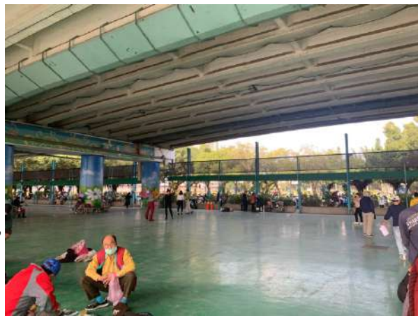
圖八：橋下廣場

廣場的旁邊銜接羽球場與桌球場，可以見到這裡經常都有居民來這裡打球，不分男女老少，可見這是一個很好的休閒娛樂場所，並不會閒置在那裏沒人使用。