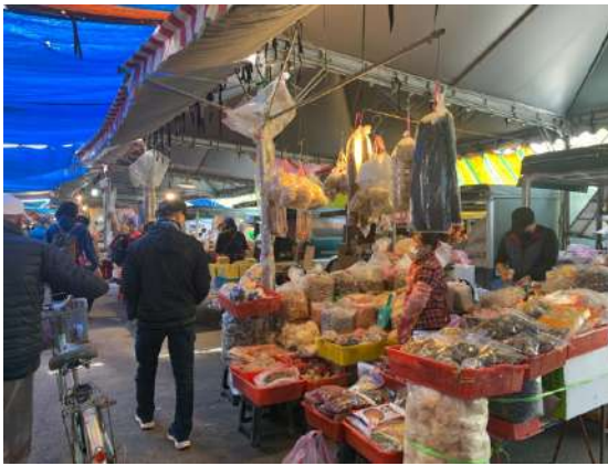
圖七：傳統市場內部

這裡的傳統市場規模也不小，實際上也是有好幾排，每一排都是很長一條，認真逛完整個傳統市場也是要花上一段時間，而且市場裡面賣的東西也是應有盡有，蔬果、熟食、肉和乾貨等等，而且我還發現這裡蠻多店家的販售價格都不高，品質卻不會比其他市場的還低，像是我當時走訪時還不小心買了一大包綠葡萄，在外面都要以 200 元甚至更高的價格才能買到的葡萄竟然被我以 100 原這個如此漂亮的數字拿到手，當時也有很多店家很吸引我，果然是許多市民喜歡來逛得傳統市場，在這裡一次可以買齊所需。