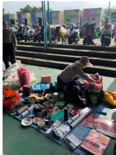
圖三：跳蚤市場內部、圖四：跳蚤市場攤販、圖五：攤販販售的商品、圖六：攤販